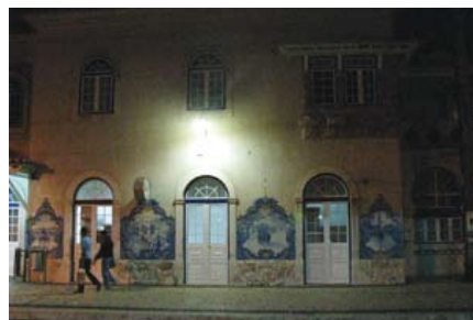
Estação ferroviária de Vila Franca de Xira

investir e visitar. Queremos jogar com dois factores, de maneira que uma cidade não seja um dormitório e tenha vida própria. Para tal, desenvolvemos o projecto “mobilidade para todos”. Concluimos que a idade das habitações, na sua maioria, são muito antigas e permeáveis. Os números confirmados pelo centro de saúde e hospital demonstram que a maioria das doenças são de origem respiratória. Depois, quanto mais viagens circularem, mais doenças provocarão. O atravessamento da nacional 10 e A1, são as principais causas. Em conclusão, a nossa prioridade é a circulação pessoas, depois a circulação de transportes públicos de emergência e segurança, em último o transporte privado.